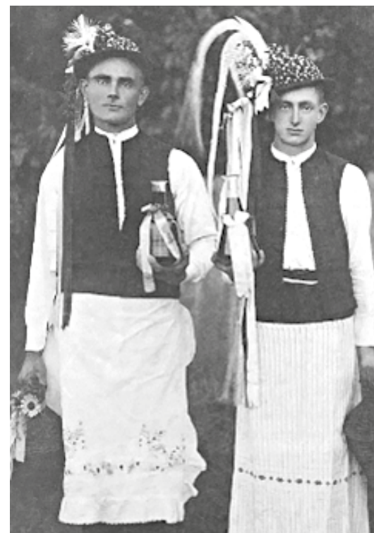
Čekovičtí hodový sklepníci v roce 1937