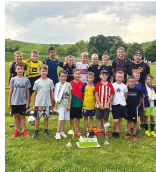
Ml. přípravka vítěz TOP skupiny okresního přeboru

Tímto ale kritika končí, chybějící články ve Zpravodaji neznamenaají, že bychom nebyli činní. Ba právě naopak, opatrně vyslovujeme přesvědčení, že to jde stále všechno nahoru a že se skutečně blýská na lepší časy v té novodobé, už čtrnáctileté historii. Mimočodem, v tom článku v r. 2021 jsem vás informoval, jak se škrábeme z nejhoršího a očekáváme lepší budoucnost. Všechno má svůj čas a tento čas u nás nebyl naplněn psaním článků, ale činností k pomalému, ale jistému vzestupu. Někdy to má sice tvar sinusoidy s pověstnou oscilací, kdy padáte i dolů, ale důležité je, že se vždy vrátíte a posouváte se ještě výš. Ale mluvm konkrétně o aktuální situaci. Hezky se nám rozrůstá členská základna, zejména v dětských kategoriích, a z toho máme opravdu radost. Tu máme i z toho, že děti vedou místní