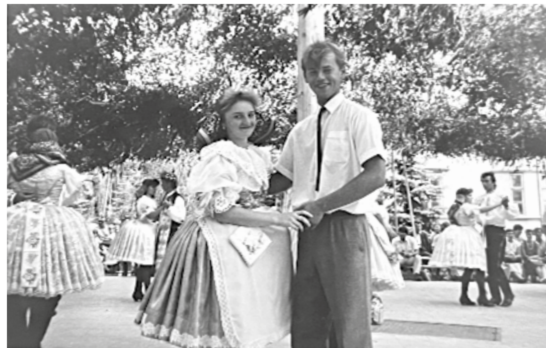
Chábí na čekovických hodech v 80. letech minulého století