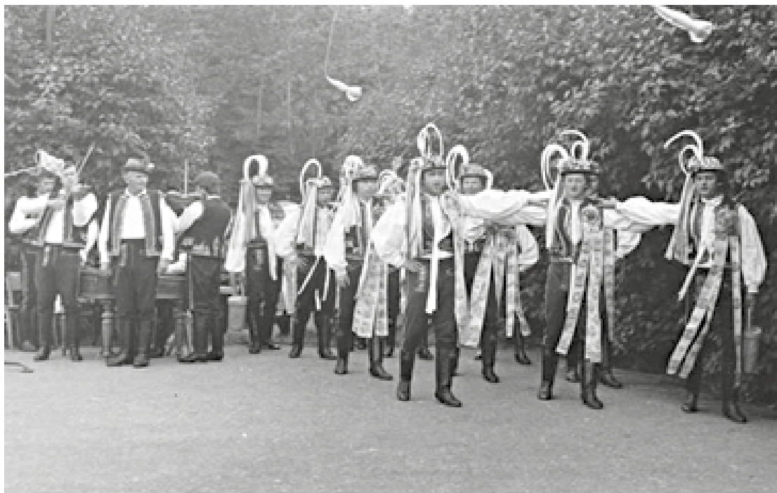
FS Zavádka na festivalu Kraj beze stínu v 70. letech

Folklor kvete jen tak, jak aktivní je jeho činitel, tedy krojovaná chasa. Na verbířských soutěžích se dlouhou dobu neobjevil žádný Čejkovják a regionální písně dokáže rozeznat už jen několik hudebně angažovaných jedinců. Takový jev není žádnou výjimkou a objevuje se i u ostatních chas. Od přeměny přirozeného folkloru k folklorismu, tedy vědomého konzervování tradice trvajícím zhruba posledních století, kontrolovaly úroveň projevu lidové kultury umělecké soubory. V místech, kde folklorní soubor fungoval, byla kulturní uvědomělost logicky vyšší. Příkladem je situace z počátku 70. let minulého století, kdy se čejkovický folklor potýkal s vážnými problémy. Z obyčejového bohatství nezbylo prakticky nic, znalost regionálních písní i krajových tanců byla značně omezená a kroj byl poznamenán dobovými prvky. Přičiněním aktivních jednotlivců vznikl národopisný krúžek zaměřený na základní výuku lidových tanců, které si kolektiv procvičoval na folklorních akcích v blízkém okolí. V návaznosti na to založili místní kantoři a hudebníci vlastní cimbálovou muziku. Tyto kroky pak posloužily jako předstupeň pro vytvoření národopisného souboru