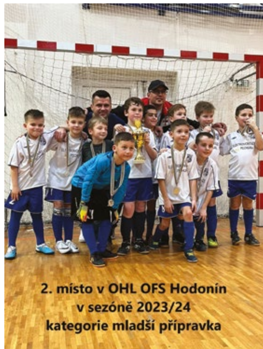
Okresní halová liga v Lužicích