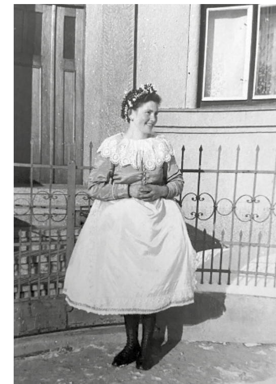
Čekovjanka s věnečkem