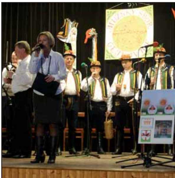
Koncert mužského sboru

Zastupitelstvo Obce Čejkovice a pracovníci Obecního úřadu přejí všem spoluobčanům příjemné prožití svátků vánočních, v novém roce 2011 hodně zdraví, štěstí, spokojenosti, rodinné pohody a osobních úspěchů.