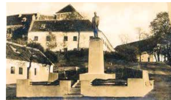
První pomník T.G.M. - rok 1928