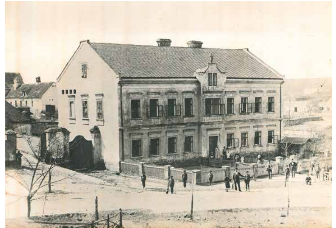
Škola v roce 1865

Z původního záměru studovat učitelství sešlo, když byl v roce 1865 T. Masaryk přijat do druhé třídy německého gymnázia v Brně, zde si přivydělával kondicemi. Kromě toho, že dosahoval výborných studijních výsledků, platil za vůdce českých studentů. Teprve v Brně pochopil své češství. Do septimy akademického gymnázia nastoupil ve Vídni. Zde jej poprvé napadlo být diplomatem. Po maturitě r. 1872 se dal T. Masaryk zapsat na vídeňskou univerzitu, kde se nejvíce věnoval studiu filosofie. Roku 1876 obhájil doktorát prací „Jaká je podstata duše Platóna.“ Následuje roční studijní pobyt v Lipsku, kde prohlubuje své znalosti filosofie a teologie. Připravuje se na habilitaci na docenta, poznává zde svou budoucí ženu Američanku Charlottu Garrigue. V roce 1878 navštívil poprvé Ameriku, kde se oženil. Roku 1882 přijal T.G.Masaryk nabídku na působení na univerzitě v Praze. Roku 1897 se stává řádným profesorem na