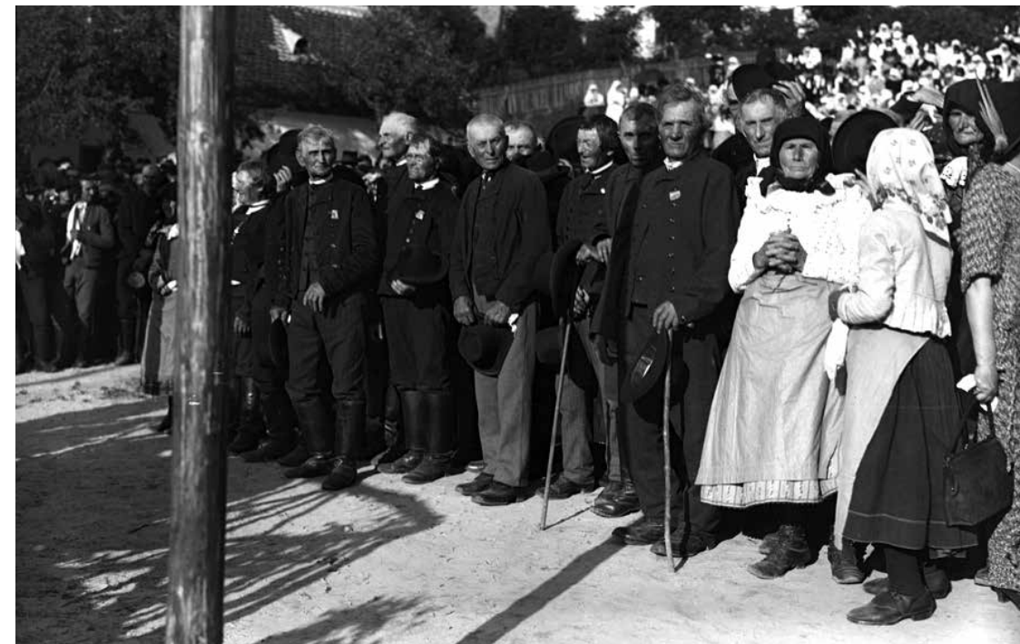
Spolužáci T.G. Masaryka

Prezident usedl s nimi k jednomu stolu a živě se s nimi bavil. U ostatních stolů se usadila jeho družina a ostatní. Zatím chasa s hudbou odebrala se na prostranství vedle školy, kde vypínala se vysoká mája, a dala se do tance. Na místě veselí shromáždili se mladí i staří. Slunce klonilo se k západu, když nastalo loučení. Ozvaly se rány z mozdířů a banderium vyprovodilo pana prezidenta daleko za Čejkovice. Pan prezident odejel se svou družinou do Židlochovic.