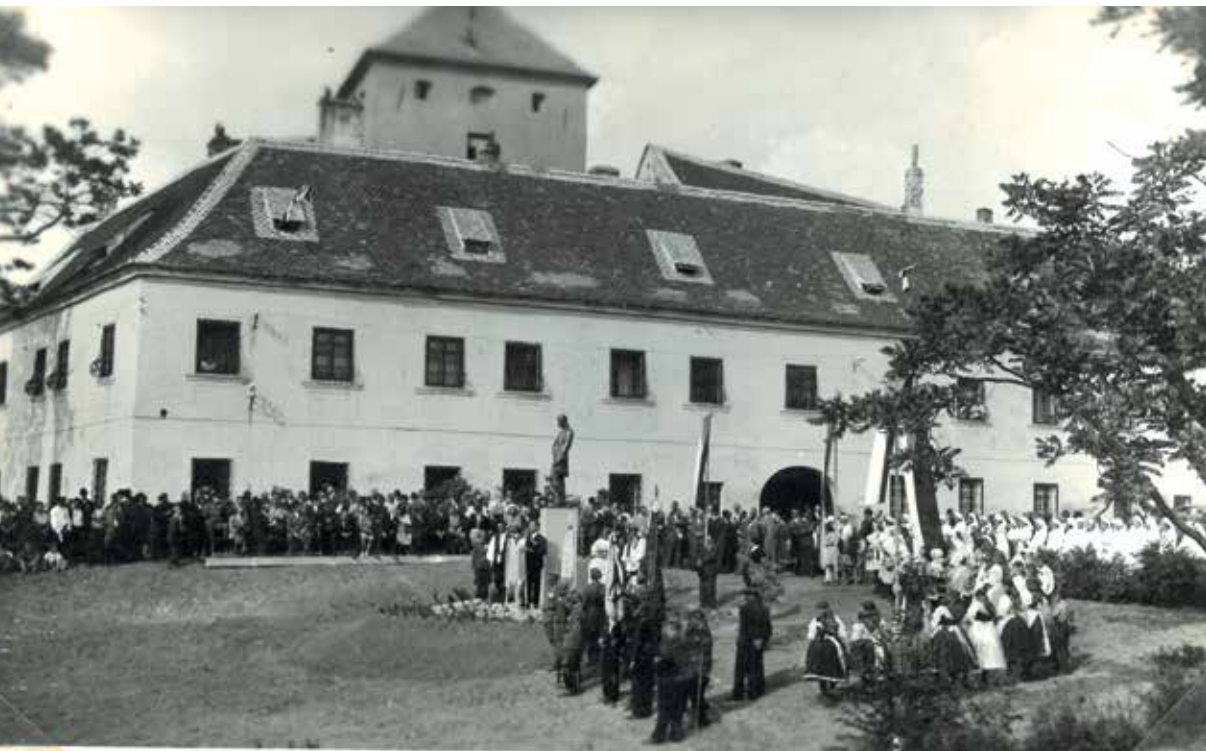
Odhalení sochy T.G.M. - rok 1947