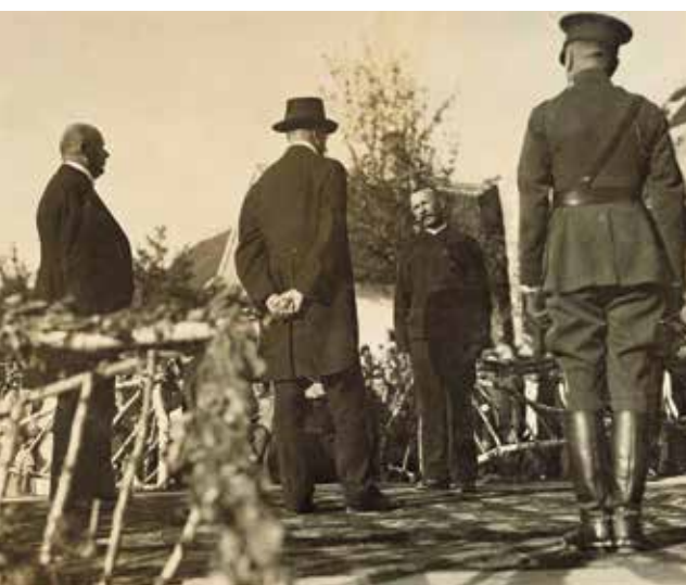
Starosta T. Opluštil vítá T.G. Masaryka

prezidenta a velké množství lidí. Zvláště zámecké návrší černalo se množstvím lidu, mezi nímž se pestřily národní kroje. Ze spolků se zúčastnily korporativně přivítání tyto: Legionáři, hasiči, Sdružení venkovské omladiny, Sokoli, Orli, Řemeslnicko-živnostenská beseda /s praporem/.