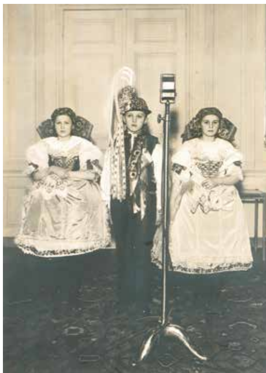
Čejkovičtí gratulanti v Lánech