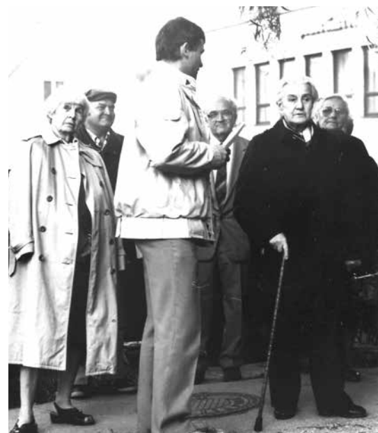
Návštěva vnuček T.G.M. v roce 1992

kteří jako děti byli v Lánech přát panu prezidentovi k jeho 87.narozeninám.