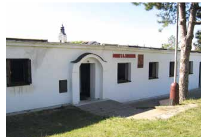
Domek T.G.M. - květen 2018