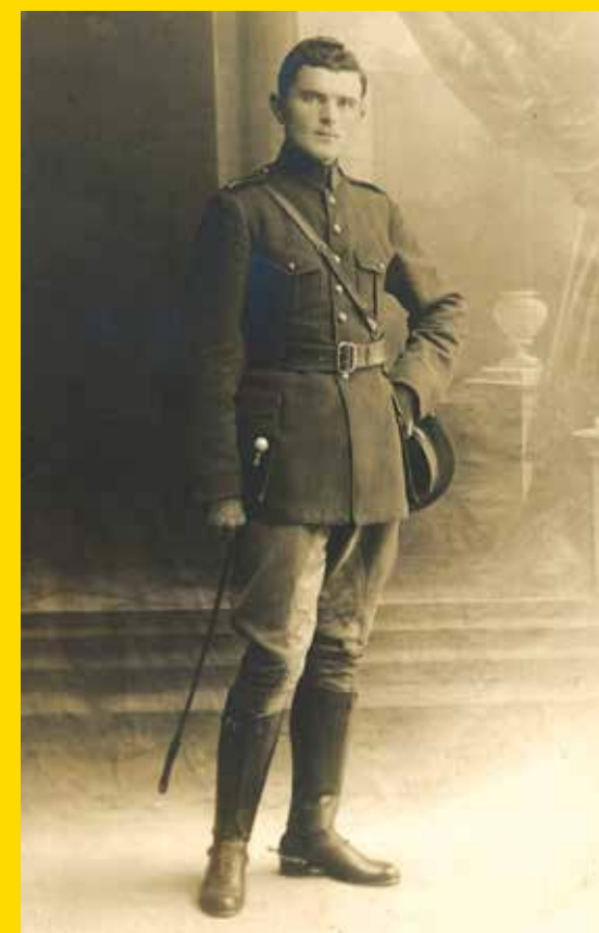
Velitel 3. pěší roty v Hlohovci v r. 1922