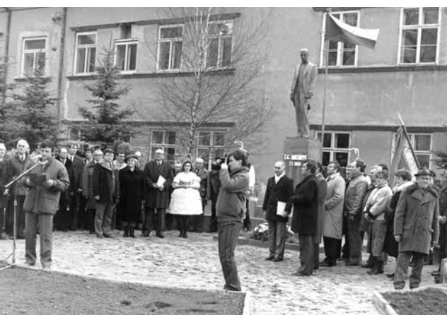
Odhalení sochy v r.1990

● V roce 1990 po generální opravě byl domek veřejnosti zpřístupněn 12. května 1990, kdy byl slavnostně otevřen za velké účasti občanů Čejkovic.