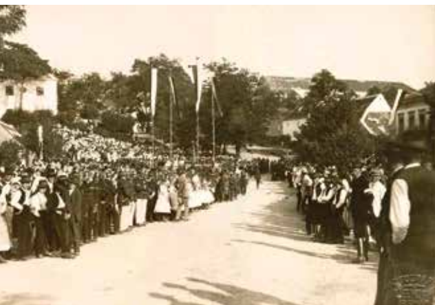
Čejkovičtí očekávají příjezd T. G. M - 19.6.1924