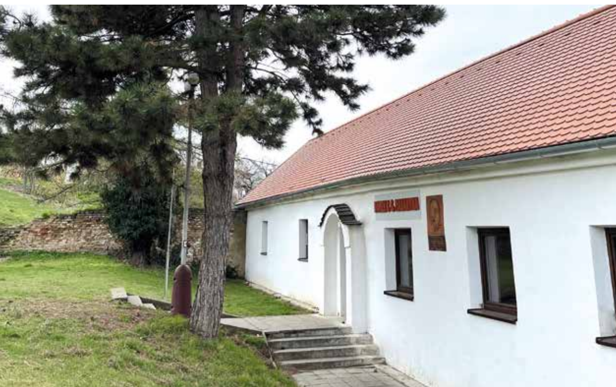
Domek T.G. Masaryka s expozicí - rok 2018