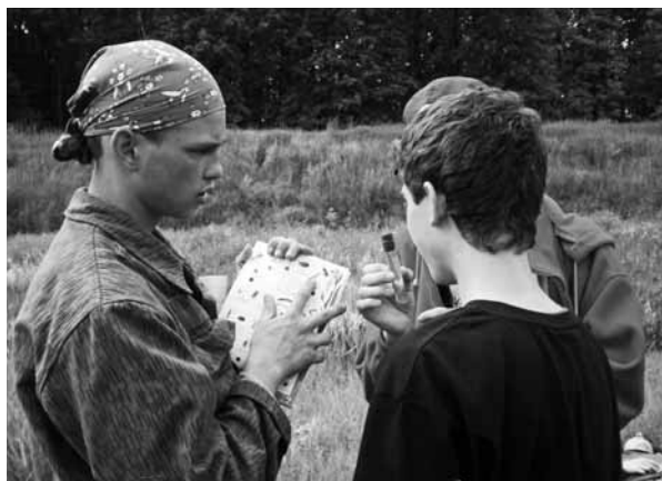
Určování vodních živočichů