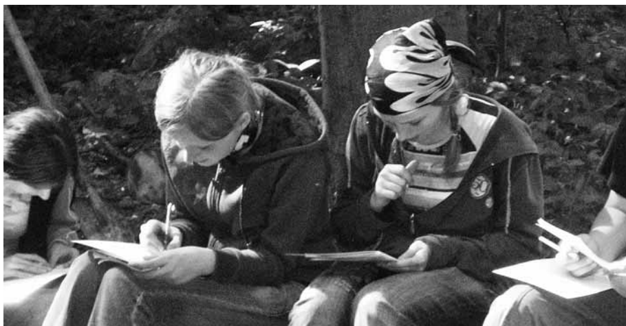
Jak nejlépe vyplnit pracovní list